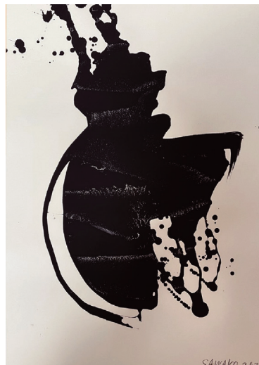
渡邊 佐和子 SAWAKO WATANABE